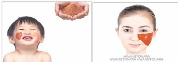
「黄土」とハチミツを使用したパック