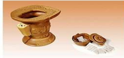
ポットと漢方パック