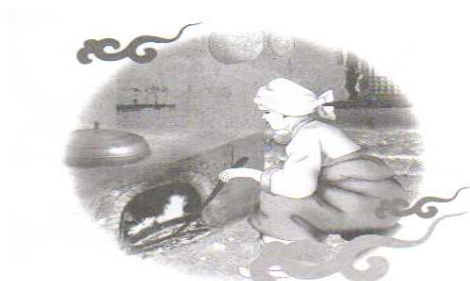
「黄土」で作られたかまど

多くの病、婦人病は、西洋医学、薬による対症療法による治療が行われており悪いところの症状を緩和する、消失することに焦点が向けられていることから更なる症状が現われたり、副作用が生じ、体、生活のバランスをさらに崩すことがあり対症療法のみで治療を行うことは望ましいやり方ではないことが認められている。